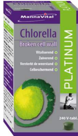
Vegetarische tablet 500 mg Chlorella (Chlorella Bijerinck) 6 tot 12 tabletten/dag, met voldoende water. Dosis gradueel opbouwen.

"Broken cell wall" voor maximale opname van nutriënten, zonder verlies aan voedingswaarde